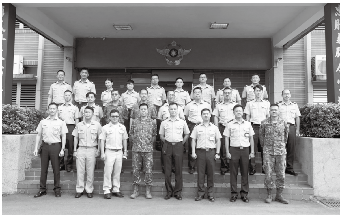
各班隊參訓學員均於營區行政大樓前方實施團體合照。